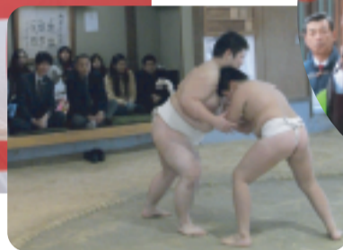
H24/1/3 香川県相撲連盟新年初稽古