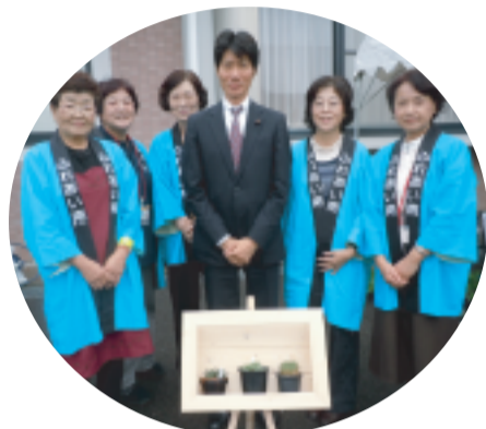
H23/11/6 第18回城南ふれあいまつり