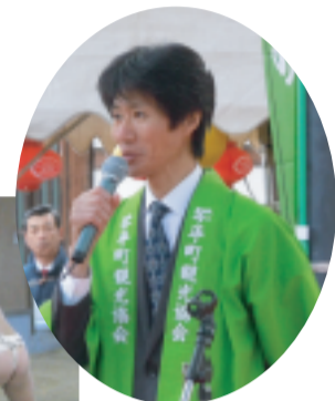
H24/1/7 第13回こんぴら 温泉まつり