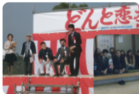
H23/11/12 東かがわ青年会議所 第3回どんと恋祭