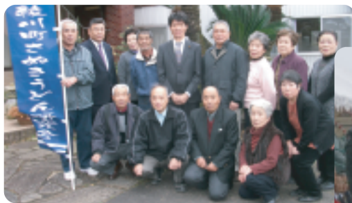
H23/12/11 自民党綾南支部ミニ集会