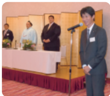
H23/12/4 琴勇輝関 十両昇進祝賀会