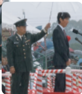
H23/11/6 自衛隊第14旅団創隊及び 駐屯地開設記念