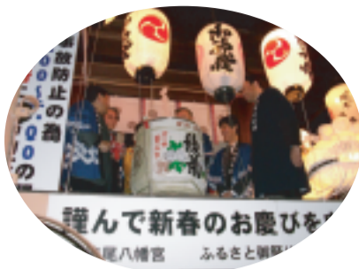
H23/12/31 石清尾八幡宮年越し新春イベント